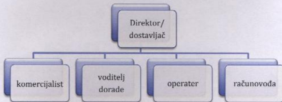
Organizacijska shema nakon restrukturiranja

Nakon restrukturiranja, planiraju zadržati svih 6 preostalih djelatnika. U nastavku je organizacijska shema prije i poslije restrukturiranja.